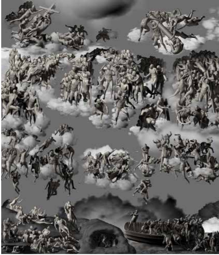
Miao Xiaochun, "The Last Judgement in Cyberspace", 2006, karşıdan görünüm, C baskı, 198x170 cm, edisyon 5/9, © Miao Xiaochun, Loubna Fine Art Society.

İlk bakışta zorlayan ve tiksindiren Piccinini ve de Bruyckere'nin eserleri, bizi biyoteknolojide öjonik (insan ırkını iyileştirmeye yönelik) siberetik ilerlemeler sonucu zihinsel olarak yırtıcı ve yok edici insanın hipnotik görüntüsüne çekerler.