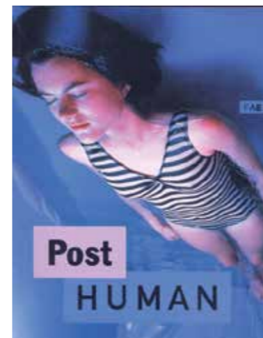
"Post Human" sergi kataloğu, 1992, küratör Jeffrey Deitch, tasarım Dan Friedman, FAE, Lausanne.

Yaşamlarımız teknolojinin hükmüne girdi. Önceleri alternatif gerçekler LSD, meskalin ve sihirli mantar gibi haplarla üretilirdi fakat bugün teknoloji sanrı yaratan maddeleri gerçeklik halimize göre değiştirdi.