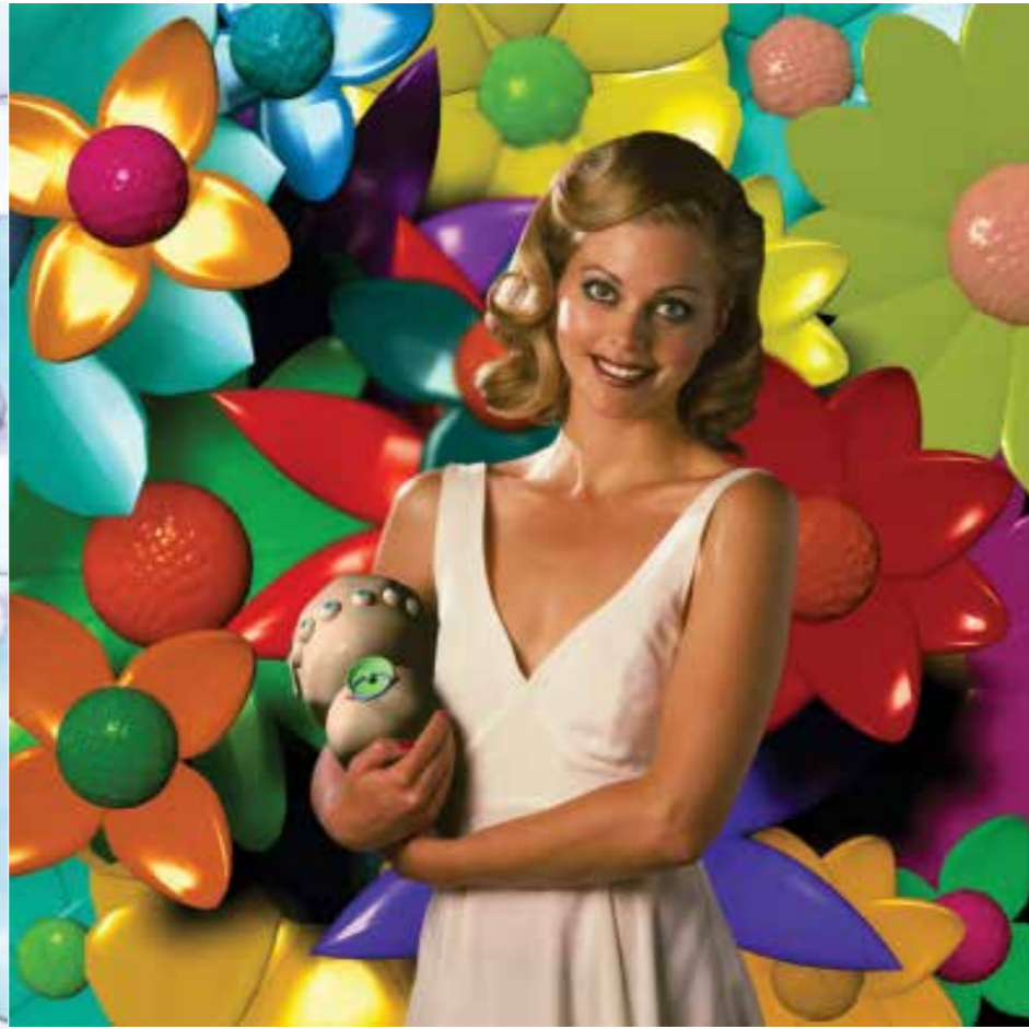
Patricia Piccinni, "Felicity", 1996, C tip fotoğrafı, 130x130 cm, sanatçının, Tolarno Galerisi ve Roslyn Oxley9 Galerisi'nin izniyle.