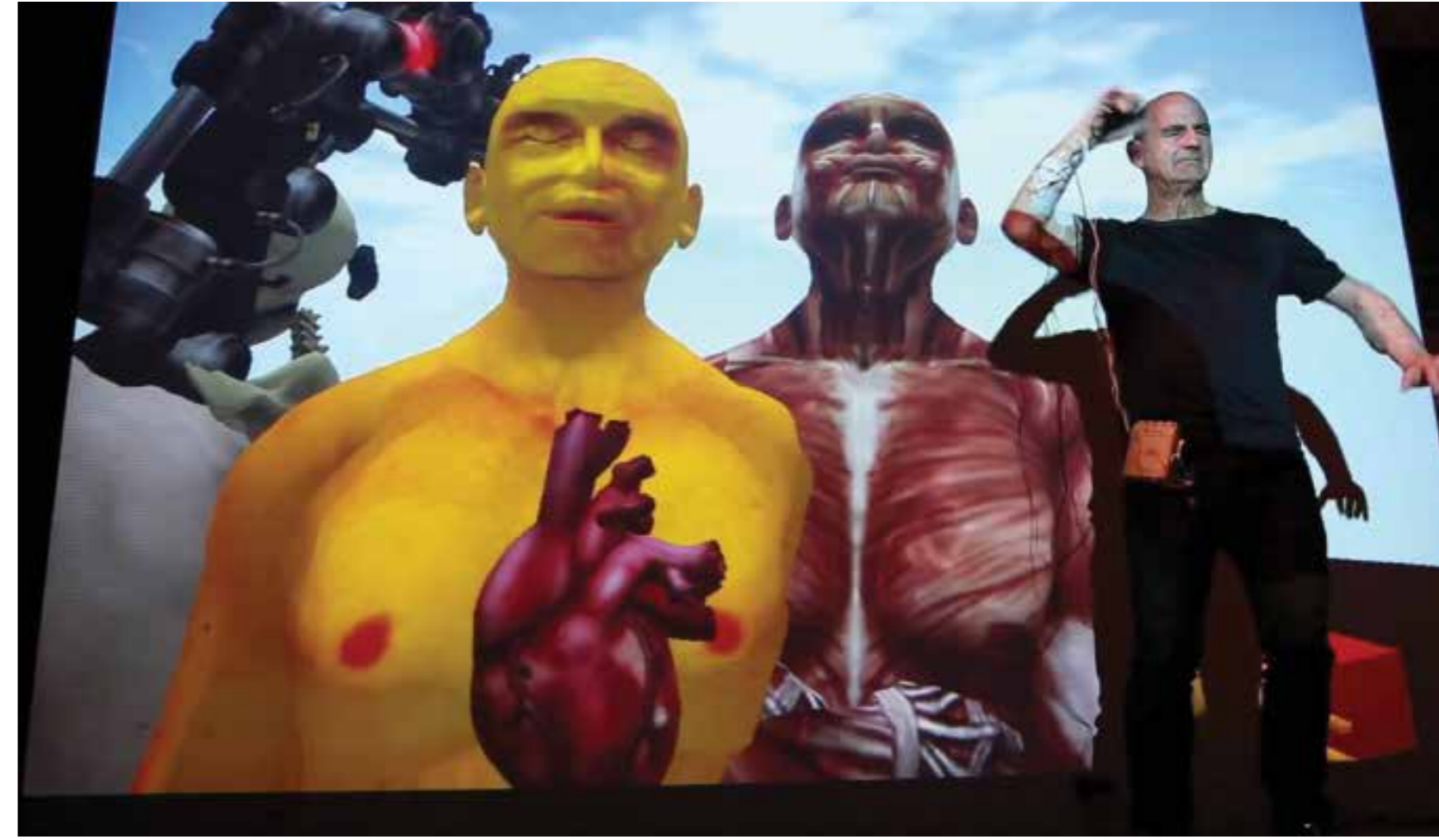
Stelarc, "Out of Your Skin", multimedya performansı, © Stelarc.