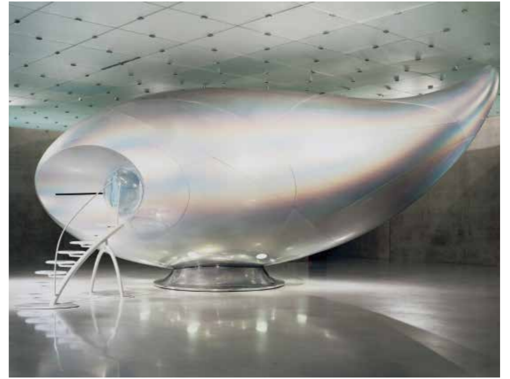
Mariko Mori, "Wave UFO", 1999-2002, karışık teknik, 528x113.4x493 cm, 2 edisyonlu

görünen bir dünyaya, barışa ve herkesin manevi değerleri paylaştığı zamansızlığa davet eder. Pop, bilimkurgu, fantazi ve Manga'ya harmanlayan estetiği onu yüksek bir rahibe gibi cisimleştirirken izleyiciyi yeryüzünün ötesinde, insan bilincinin tahrip edici dogmalarından bağımsız zamanlar, mekanlar ve gerçeklikler arası bir yolculuğa davet eder. Mori'nin kutsal dünyası insan doğasının şiddete yönelik olumsuzlukları ile sallanır ve bir gün savaş, nefret, anlayışsızlık ve korkunun genetik olarak insan DNA'sından uzaklaşmasını arzular.